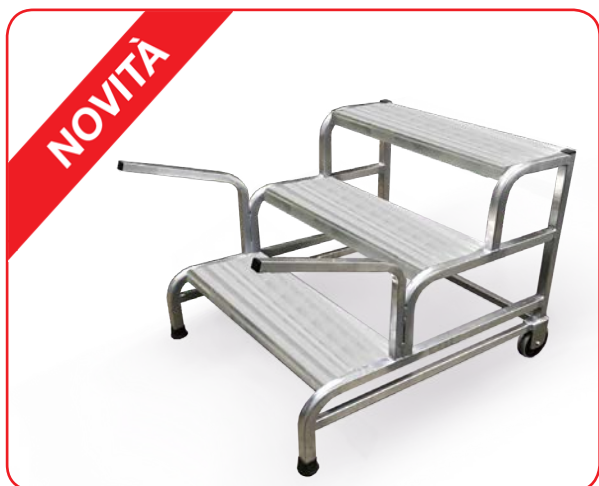
Cargo 3 gr. con Kit maniglie di sollevamento + rotelle