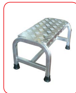
Cargo da 1 gradino