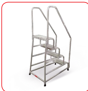
Corrimani laterali destro e sinistro