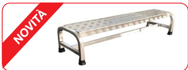
Cargo con misure speciali (RICHIEDERE PREVENTIVO)