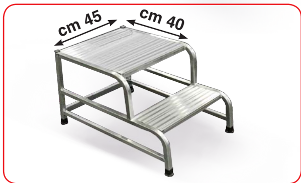
Cargo 2 gradini con piattaforma maggiorata