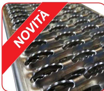
Gradini in alluminio grigliato (optional) Supergrip e drenanti per olio e neve