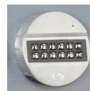
Mod. KE : EM2020+T6530