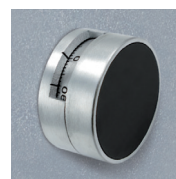
Mod. KC: LG3390+LG1730